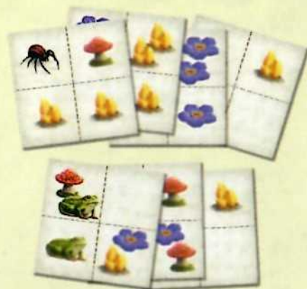
8 tuiles Ingrédients