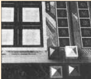
Placer les pions de score sur la réglette des points.