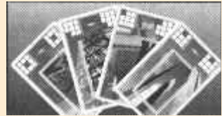
4 cartes de construction par joueur.