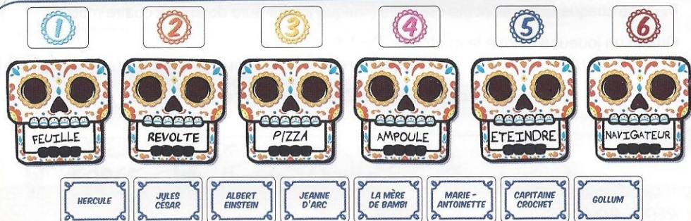
Exemple à 6 joueurs.

Remarque : A 8 joueurs, on ne rajoute donc pas de carte Personnage.